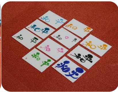
世の中の平和を祈って…

3月18日、サテライトで体操教室を行いました。普段はあまり使わない筋肉を使ったり、腹筋やストレッチをして気分がとてもしフレッシュできて、楽しかったです。